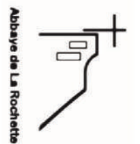
Abbaye de La Rochette